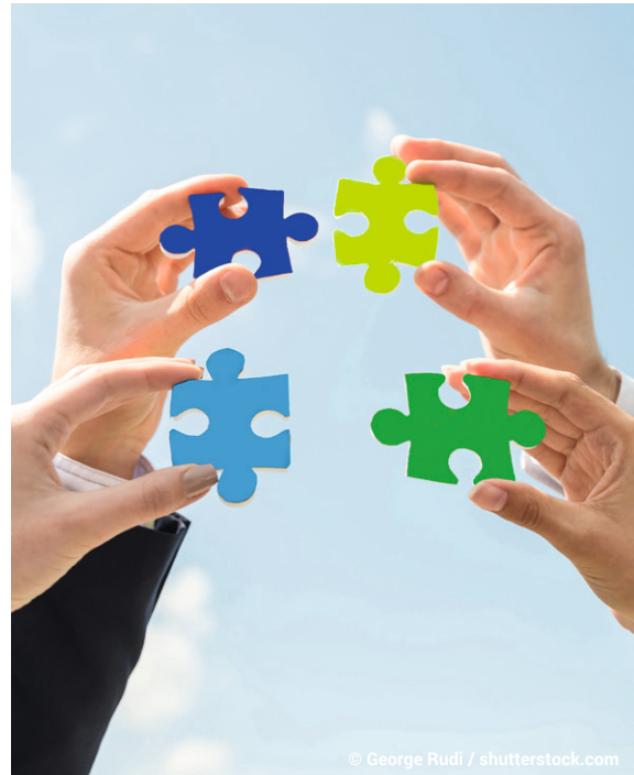
Kombination aus Unterweisung und Spielen: Ein Erfolgsrezept der domeba

» Für die nachhaltige Kommunikation von Arbeitsschutz-Themen reichen schön gestaltete Unterweisungsfolien nicht mehr aus. Um die Aufmerksamkeit der Mitarbeiter zu gewinnen und Lernerfolge sicherzustellen, müssen Anreizsysteme geschaffen werden. « >